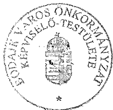
Würczinger Lóránt polgármester

A rendeletet a mai napon kihirdettem. Bodajk, 2019. március 27.