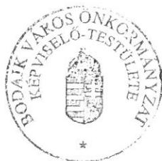
Wurzinger Lóránt polgármester