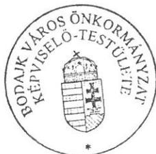
Wurzinger Lóránt polgármester